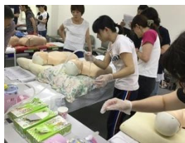
Ejercicios de atención médica