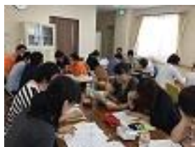
Preparación del plan de cuidados de enfermería