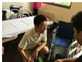
Práctica de habilidades de enfermería